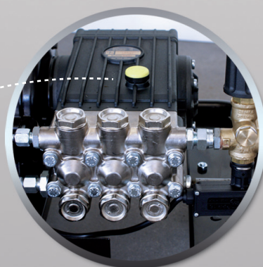
Langsam laufende Industriekurbel- wellenpumpe